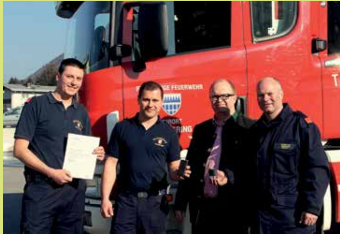
Für den ältesten gebrauchstüchtigen Personenrufempfänger von NÖ bekamen wir von der Fa. SWISSPHONE das neueste Alarmierungsgerät im Wert von € 380.- geschenkt