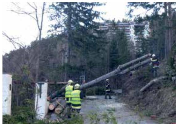
Entwurzelte Bäume auf der Gläserstraße blockierten die Fahrbahn und beschädigten eine Stromleitung

Im März mussten wir aufgrund des heftigen Sturmes mehrmals zu technischen Einsätzen ausrücken, vorwiegend zur Entfernung von auf Straßen liegenden Bäumen.