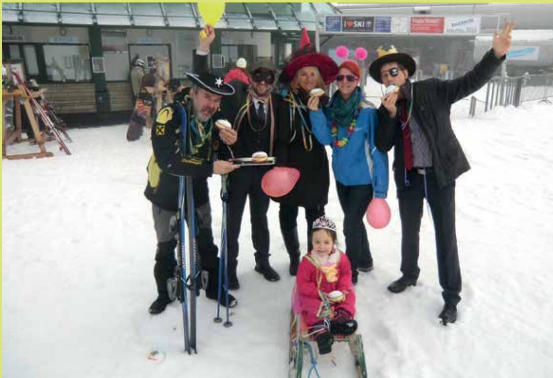
Ausgelassene Stimmung beim Maskenlauf am Faschingsdienstag bei der Talstation der Bergbahn Semmering.