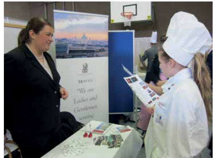
Die Schülerinnen und Schüler der Tourismusschulen informierten sich über Karrieremöglichkeiten im Tourismus – hier etwa am Stand des neuen Wiener Top-Hotels „Ritz Carlton“.