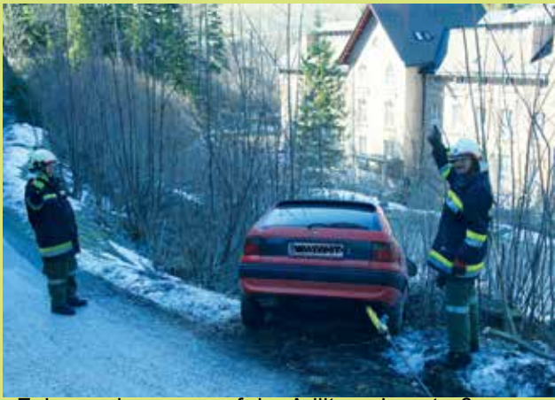
Fahrzeugbergung auf der Adlitzgrabenstraße