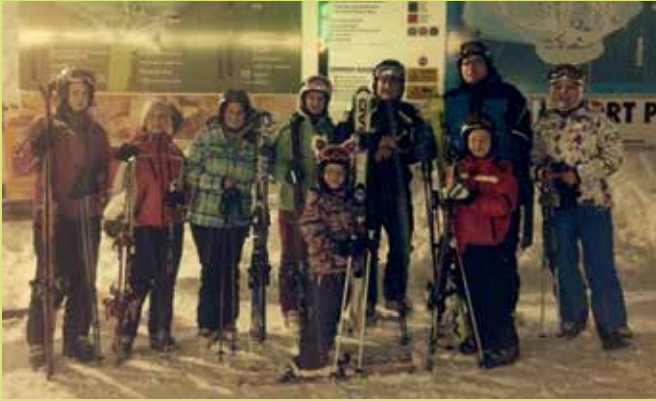
Statt einer Chorprobe genossen die Sänger des Zaubergkluges einen Schiabend am Hirschenkogel